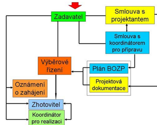
Schéma č. 2:

Oznámení o zahájení stavby se zasílá na oblastní inspektorát práce, do jehož regionální působnosti spadá místo stavby, a to 8 dní před předáním staveniště prvnímu zhotoviteli. Oznámení musí být vyplněno ve všech rubrikách a podepsáno zadavatelem. Koordinátor bude vždy konkrétní fyzická osoba, která může být zaměstnancem právnické osoby (se kterou může zadavatel uzavřít smlouvu a jí pak např. platit faktury za činnost koordinátora). Zadavatel uzavírá smlouvu s koordinátorem, kde si domluví např. i pravomoci koordinátora na staveništi nad rámec zákona (např. dávání návrhů ke snížení fakturačního plnění při zjištění porušení bezpečnos-